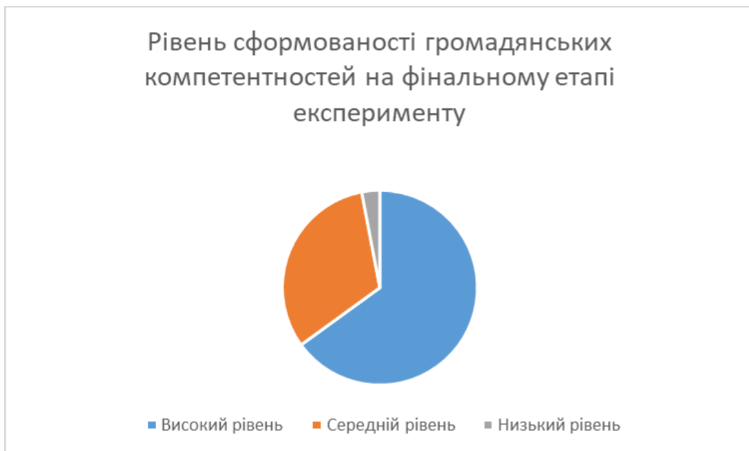
Рисунок 2.2. – Рівень сформованості громадянських компетентностей на фінальному етапі експерименту

не змінився і залишився на рівні 30%, а низький рівень знань щодо громадянських компетентностей залишився у 10% респондентів.